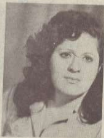
ԱՆԱՆՅԱՆ ՌԱՅԻՐԻ ՄՈՒՐԱԳՅԱՆ