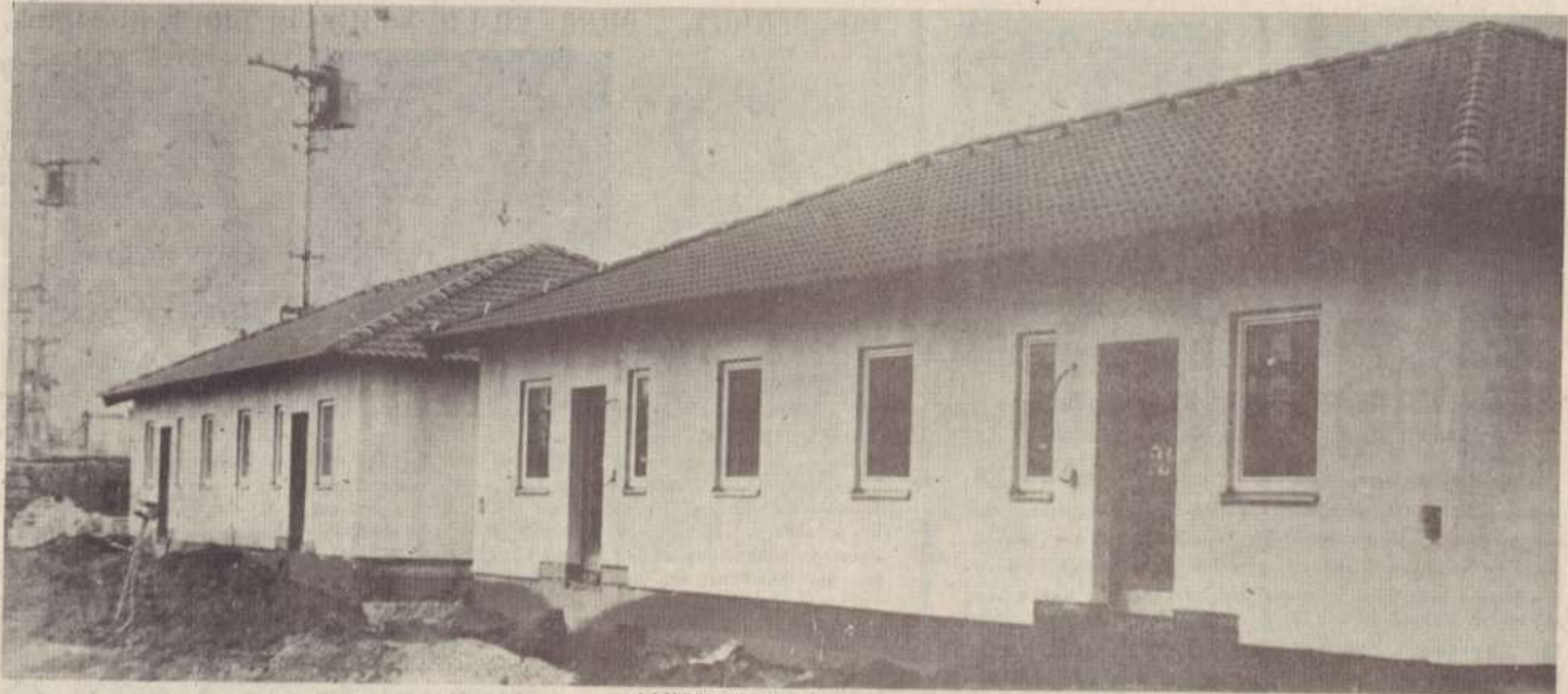
ՆՎԱՐՈՒՄ՝ Ավտոտրիանյան սպանի բնակիչները: