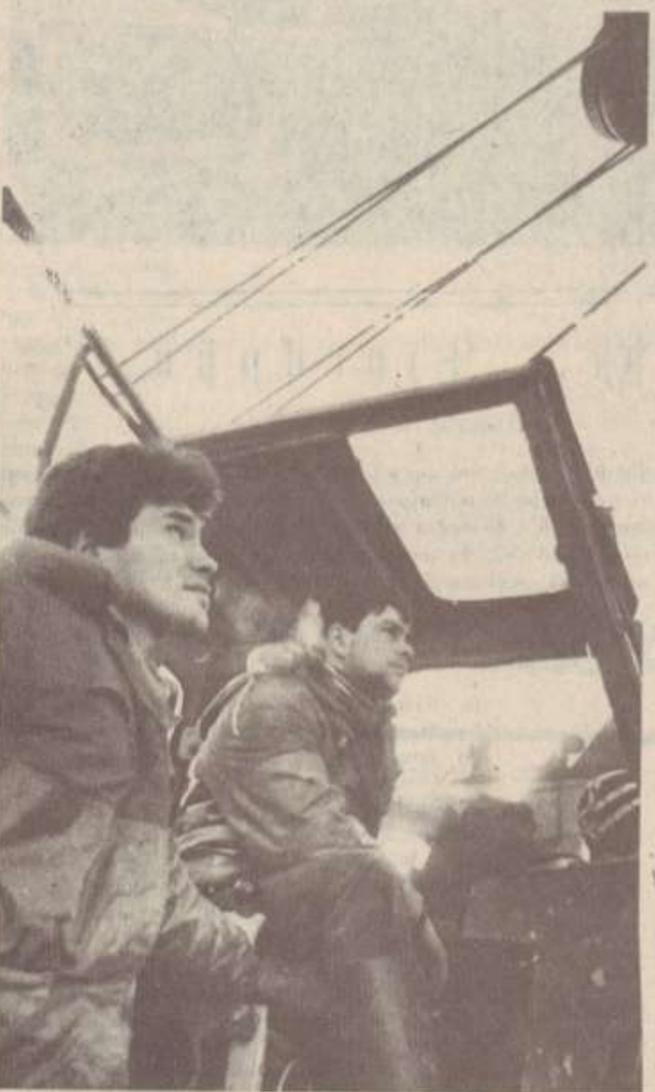
ՆԿԱՐՈՒՄ.— Դերմի մեխանիզատորները Օիրակացի կոնույում պշխատանք կատարելիս: