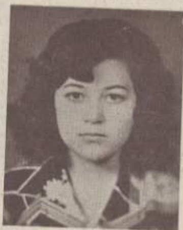
ՄԱՐՈ ՆԱՊՈՒԵՆՆԻ ՇԻՐԱԿՑԱՆ