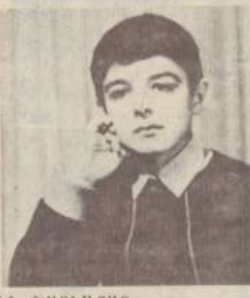
ԵՐԿՐԱՇԱՐԺ, ԹԵ՛՝ ՄԱՂԱՔԱՂ