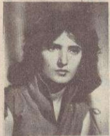
ՊԱՏՄՈՒՄ Է ԸՆԿԵՐՈՒՄԻՆ

Ամեն ինչ կիսատ թողած հեռացա, սիրելի ծնողներ, պահեք և փայփայեք որբացած իմ բալիկներին, մի՛ տխրեք, ես ձեզ հետ եմ՝ ձեր մտքում, ձեր հոգու մեջ: Լաց մի՛ լինիր իմ անուշ մայրիկ, ես սիրում եմ ծիծաղ ու երջանկություն: