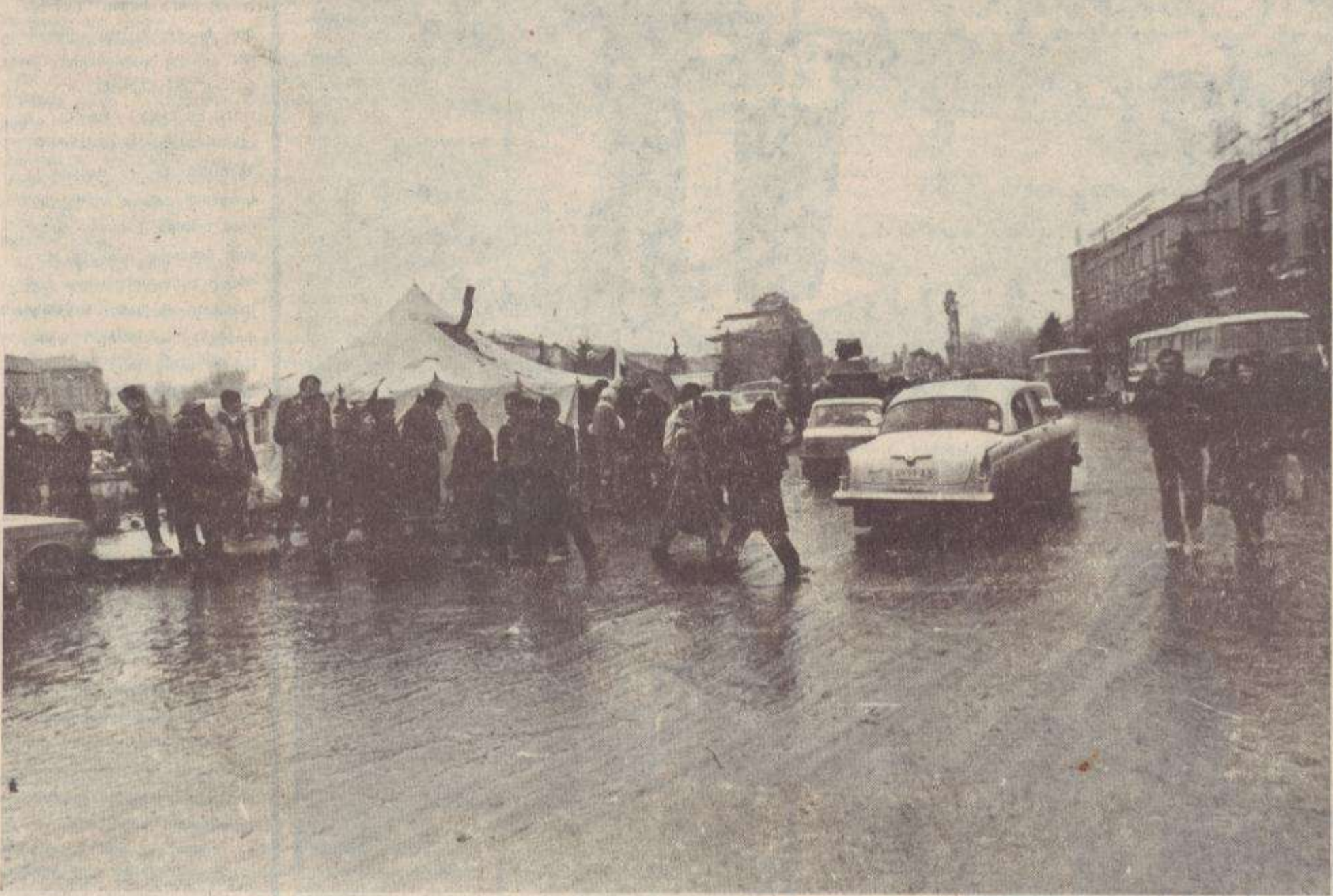
Քաղաքի կենտրոնական հրապարակում ամեն ինչ շնչում էր աղիտով: