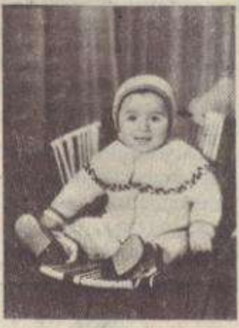
Ընկերն էր նրա... միասին էլ հանձնվեցին հողին: