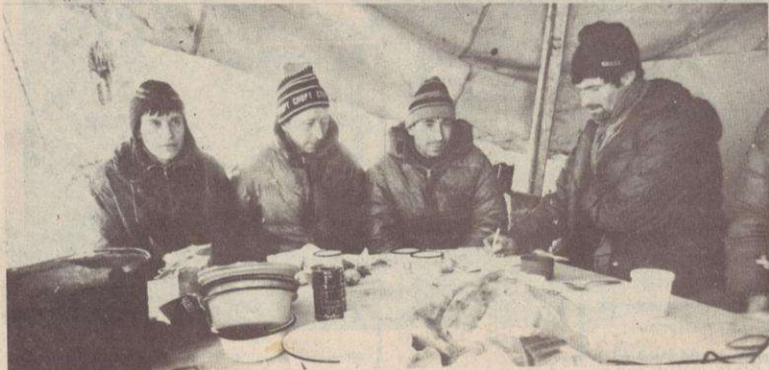
Գորկիից եկած փրկարեները «տեղավորվել կեն» Բաղախային մարզադաշտում: