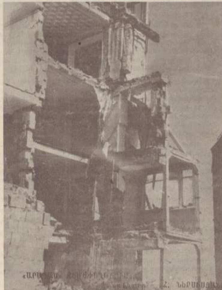
ԱՐՄԵՆ ԵՆԻՃԻՎՈՒՄԸ ԵՎ ՆԵՐՍԵՅԱՆ

նըվում Լիլիթի դասընկերնե- րը՝ դպրոցի հրաշքով փրկված 40 աշակերտներ, որոնք ի- րենց հետ տարել էին Լիլիթի անտիպ բանաստեղծություննե- րի ձեռագիր ժողովածուն: Փա- րիզում հրատարակվող երկըզ վյան «Կամք» օրաթերթը 1989 թ., սեպտեմբերի 1-2-ի, 4-5-ի և 6-ի համարներում տը- պագրեց Լիլիթի բանաստեղ- ծությունները: Համարներից մեկում տպա- գրված է «Նարարաղ» բանաս- տեղծությունը և հակիրճ նա- խախոսք, որն ավարտվում է «Այո՛, Լիլիթի սիրտը Արցախ կը տրոփէր» խոսքերով: Այս բանաստեղծությունը տեղ է գտել նաև Սարդարապատի թանգարանում Արցախին նը- վիրված սրահում: ԱՐԱՄԱՅԻՍ ՕԻՐԱԶՈՒՆԻ