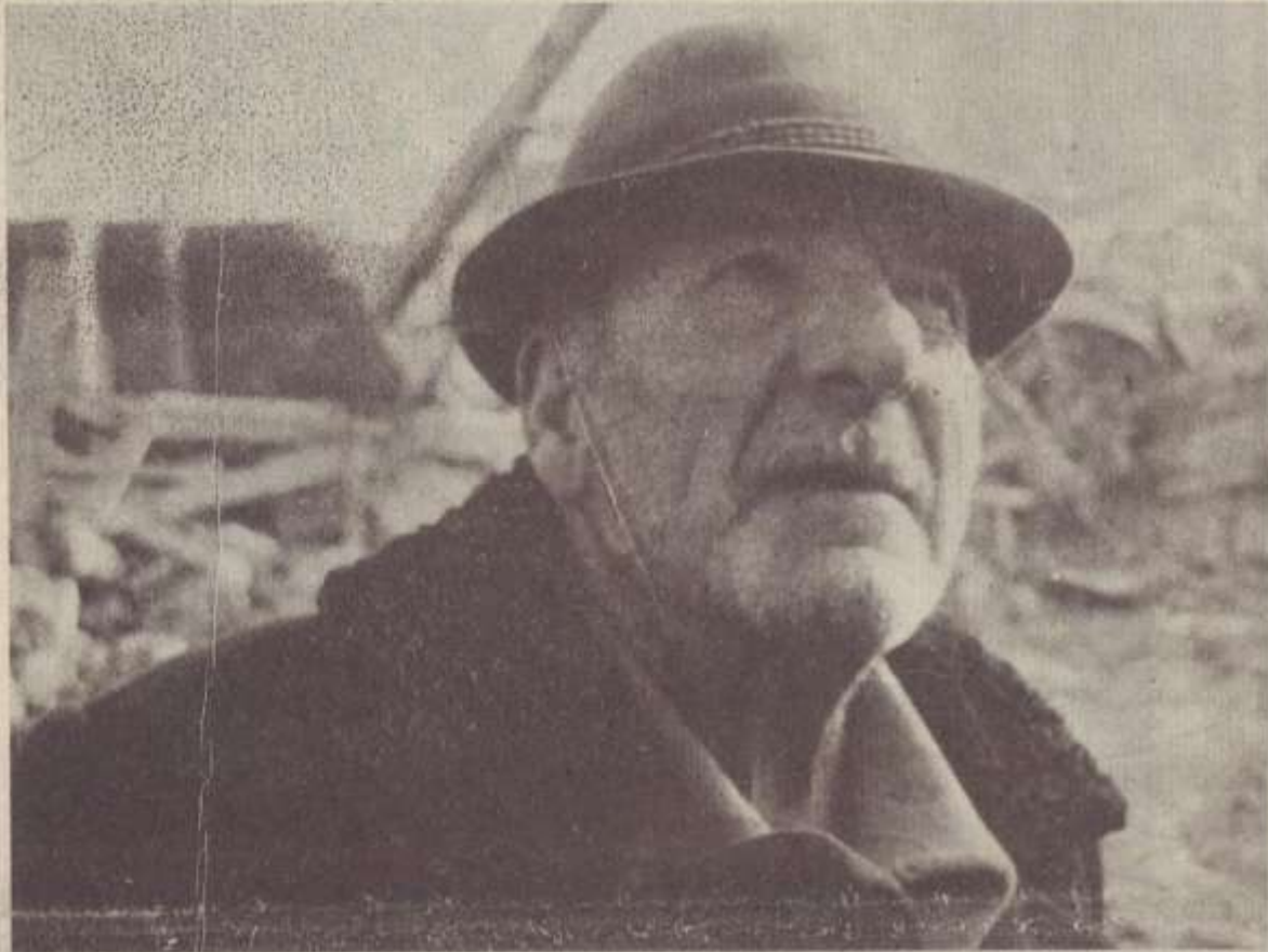
ԲԱՆԻՈՒՄԻ տունը Լաեղվի...

ՄԻ ԽՈՒՄԻ ՈՐԴԵՆՈՒՄՆԵՐ ՄԱՅՐԵՐԻ ԱՆՈՒՆԵՑ՝ Է. ՀԱՐՈՒԹՅՈՒՆՅԱՆ