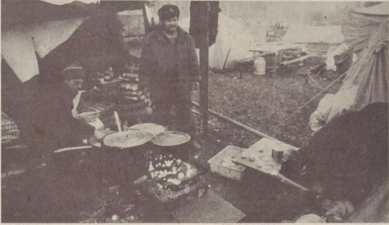
Տափ հաշ՝ աղետյակներին:

Ուլան Բատորից մեր քաղաք շտապով եկած խմբի ղեկավարը՝ Մոնղոլական Ժողովրդական Հանրապետության արտաքին տնտեսական կապերի և մատակարարման մինիստրի առաջին տեղակալ Գախիի Գոտովը «Բանվորի» խմբագրության աշխատակիցների հետ ունեցած հանդիպման ժամանակ հայտնեց այն սրտակից վերաբերմունքի մասին, որ դրսևորել են իր հայրենակիցները Հայաստանում տեղի ունեցած երկրաշարժի բոթը առնելուց հետո: Իսկ համրապետության կառավարությունը ժամանած առաջին խմբի հետ աղտեղյակներին անհատուց ուղարկել էր 20 տաք լուրտ, 300 հազար տուփ տավարի շոգեխաշած մսի պահածո, 10 մլն հատ թանկարժեք դեղահար և այլ ապրանքներ: Լեռնիկանում աշխատելու կմնան 4 առաջնակարգ մասնագետներ և 7 շինարար բանվորներ, որոնց խումբը մոտ ապագայում կը համալրվի նոր մարդկանցով: