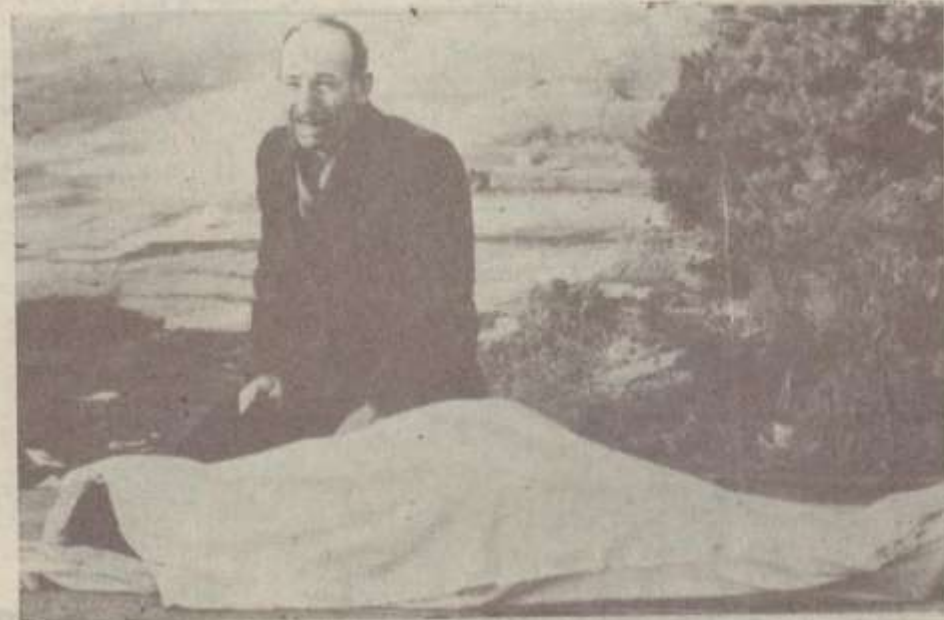
Ես ինչ գուցավ եր, անտաված ասված...