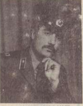
ՀԱՄԼԵՏ ԲԱԳԿԱՏԻ ՄՇԵՑՑԱՆ