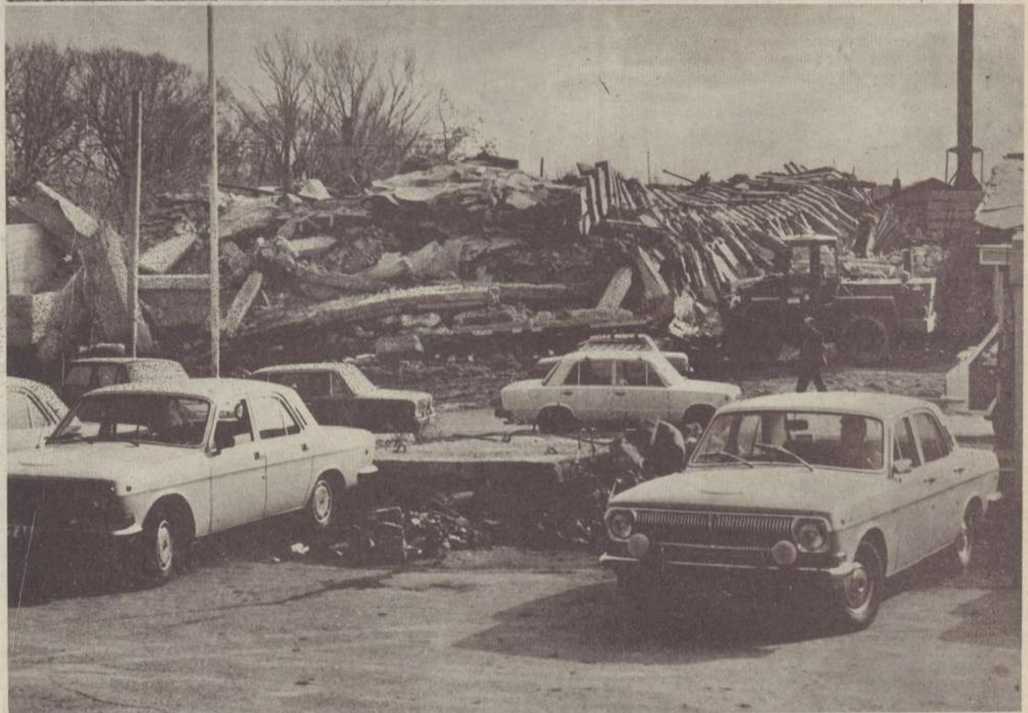
Շանուգոյձման շհանն եկամ կենտոնական զրա դարանի ավերակները: